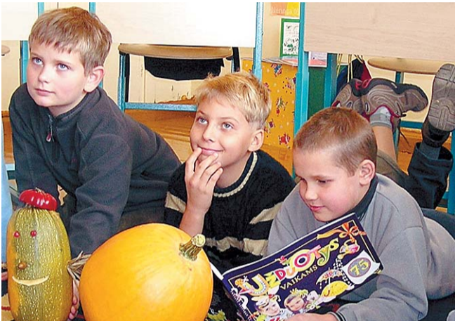
Centre veikla organizuojama taip, kad mokiniai įgytų pagrindinį išsilavinimą bei išmokyti kalbos ir galėtų integruotis į girdinčiųjų bendruomenę.

rodos, naujų knygų pristatymai, susitikimai su įdomiais žmonėmis, svečiais iš kitų mokyklų, buvusiais mokiniais, mokinių tėvais. Šiuolaikiškai įrengtoje kompiuterių klasėje vedamos pamokos, tobulinami vaikų informaciniai gebėjimai, laisvalaikio vaikai gali žiūrėti kino filmus, žaisti kompiuterinius žaidimus, specialios vaizdo kameros pagalba bendrauti su draugais internetu.