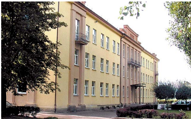
Kaune esantis Kurčiųjų ir neprigirdinčiųjų ugdymo centras ugdo sutrikusios klausos vaikus iš visos Lietuvos.

Modernioje bibliotekoje - informaciniame centre vedamos pamokos, rengiamos knygų pa-